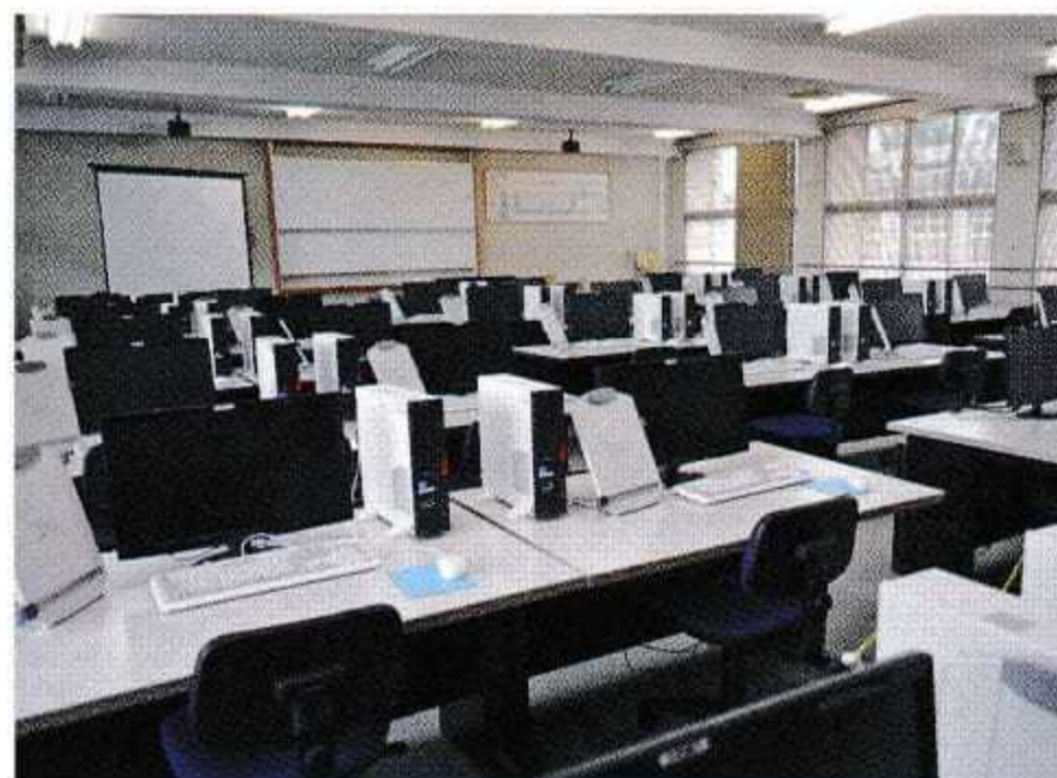
電子計算機実習室