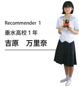
Recommender 1 垂水高校1年 吉原 万里奈