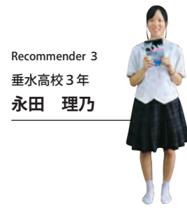
Recommender 3 垂水高校3年 永田 理乃