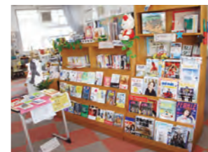
1 過去作品の「魔女の宅急便」 2 図書室入口には新刊などが並ぶ