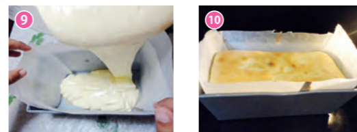
9 / 生地を型の八分目まで流し入れたら、空気を抜くため型を2度水平で固い台の上で約2cm浮かせそのまま落とす。10 / 180℃のオーブンで10分焼き、続けて150℃で約40分焼く。中心に竹串を刺して何も付いてこなければ焼き上がり。型から外さないまま粗熱を取れば完成！！