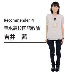
Recommender 4 垂水高校国語教諭 吉井 茜