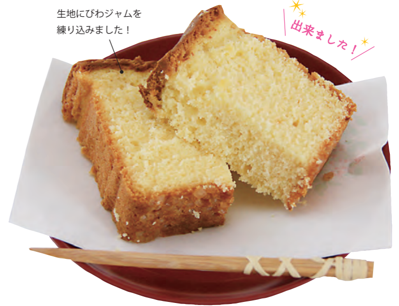
生地にびわジャムを練り込みました！