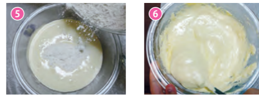
5 / ゴムベラに持ち替え、軽くふらつた薄力粉を加える。6 / 生地を中心にひっくり返すように、4分の1ずつ回転させながら、気泡を潰さないように粉っぽさがなくなるまで混ぜる。