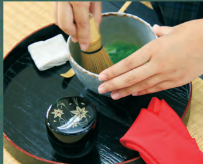
↑垂水高校では、生活デザイン科の授業として「茶道・華道・陶芸」を学んでいます。また部活としても「茶道部」があります。

6 ページにわたってお届けした「垂高ランチ」どうでしたか？そもそも、特集タイトルの「ランチ」とは、「朝食」を示す「ブレイクファースト」と「昼食」を示す「ランチ」の合成語で、本来「遅い朝食」を意味します。今回の特集では、私たちの身近な食をテーマとしたことから、様々な取組を表すために、あえて「ランチ」と名付けてみました。ちょっと強引だったかもしれませんが、垂水高校の活動や私たちのアクティブさを感じていただけたのではないのでしょうか。垂水高校には、気兼ねなく相談でき、分かるまで勉強をサポートしてくださる先生と、私たちのような高校生がいます。中学生の皆さん、一緒に楽しい高校生活を過ごしてみませんか？多くの中学生の皆さんのご入学をお待ちしています！