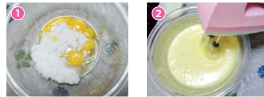
1 / ボウルに材料A (全卵・卵黄・上白糖) を入れ、軽く泡立て器で混ぜる。2 / 湯せんに使うお湯は一度沸騰させておき、工程1のボウルをあてながらハンドミキサーでしっかり泡立てる。