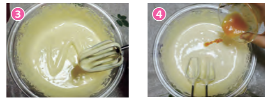
3 / 工程2が人肌の温度になったら湯せんから外し「の」の字が書けるくらいまでしっかりと泡立てる。4 / 工程3に材料B (はちみつ・水・びわジャム) を入れ、軽くハンドミキサーで混ぜ合わせる。