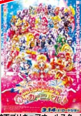
映画プリキュアオールスターズ 春のカーニバル♪