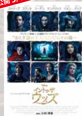
イントゥ・ザ・ウッズ