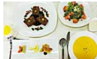
◎食物検定1級の料理

最 初の頃は、ずばっと指摘して くる先生が正直少し苦手なと ころもありました。「これじゃだめだ よね。はい、やり直し。」と先生から 何回やり直しをさせられたことか。3 年生になって、先生が担任になった時 もちょっとドキドキしていましたが、 先生と接する中で、「厳しい指導も私 たち生徒の事を一番に考えているから こそなんだ。」という事が分かってき て、先生の授業が楽しみになってい 私がいきました。生活デザイン科では、 1年生の頃から様々な検定に挑戦して いて、食物調理、被服製作の和服・洋 服の3つの検定で1級を取得できたら 「3冠王」となります。あと1つ！被 服製作の洋服で「3冠王」という時、 なんと私は検定前にインフルエンザに なってしまったのです。「インフルエ ンザになるなんて、なんてついてない んだ。もう駄目かな。」と諦めそうに なりましたが、先生は休みの日にも準 備や練習に付き合ってくれて、本当に 丁寧に分かりやすく指導してください ました。きっと先生じゃなきゃ私が「3 冠王」をとることはできなかったと思 います。先生、本当にありがとう。