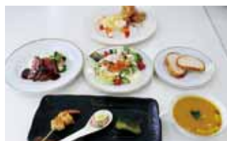
◎保護者へのおもてなし料理