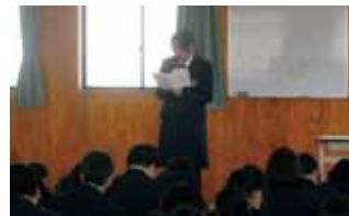
◎先輩へ進路体験発表