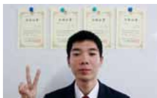
◎全商検定4種目1級合格！