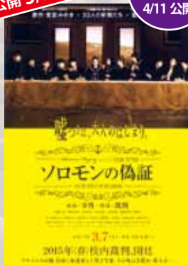
ソロモンの偽証 前篇・事件