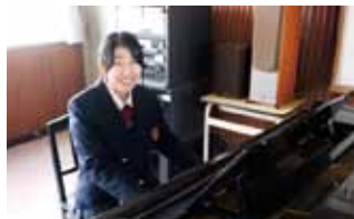
◎部活引退後はピアノにも挑戦