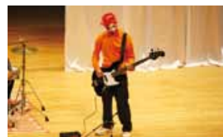
◎文化祭はバンド演奏