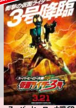
スーパーヒーロー大戦 GP 仮面ライダー 3号