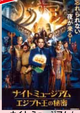
ナイトミュージアム / エジプト王の秘密