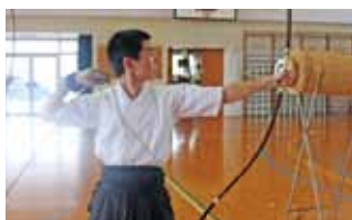
◎弓道部で3年間を過ごす！