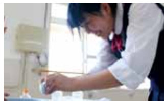
◎保健部部长として活躍！