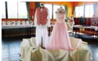
◎桜をテーマに製作したドレス