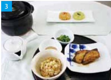
1. 2/カンパチ料理コンテストの表彰式 3/講習会で作ったおやきとカンパチ飯 4/講習会の様子

パチ料理講習会」を開催しました。講習会では「3度美味しいカンパチ飯」と「垂高風おやき」を作りました。大ベテランのお母さん方の前に、緊張する場面もありましたが、皆さんに助けていただきながら、楽しい講習会となりました。「今度の民泊の時に必ず作ります」とレシピも大変気に入っていた皆さまに。垂高から地域の皆さんに。地域の皆さんからさらに県外の皆さんに。垂水の美味しいものが伝わりますように。垂高のチャレンジはまだまだ続きます。