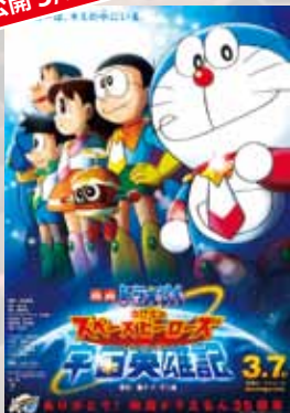
映画ドラえもん のび太の宇宙英雄記 (スペースヒーローズ)