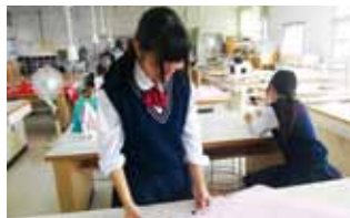
◎ドレス製作の様子