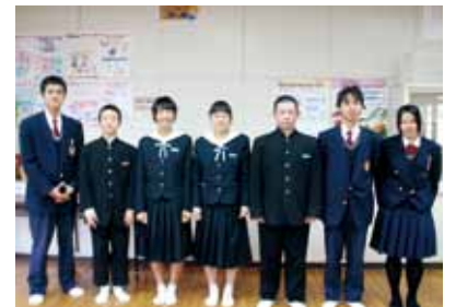
↑中学生との対談の様子（対談は、垂水中央中学校にて開催いたしました！）

本誌第2号で組まれた「生徒対談先輩×後輩」久々の登場です！今回は、普通科の2年生と1年生による対談でした。 今回は学校を飛び出し、垂水中央学校の生徒会役員の皆さんと、垂水中央中学校卒の垂水高校生徒会役員による対談です。地元ということもあり、垂水高校生も半数以上が垂水中央中学校出身です。中学生の皆さんが、これから高校や進路について考える時の手助けになればいいなという思いから、今回の対談が実現しました。お忙しい中、ご協力いただいた中学校の方々、本当にありがとうございました。 場所は懐かしい中学校の教室。楽しい雰囲気と緊張する気持ちが入り混じる中、いざ対談開始です！