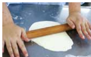
◎課題研究テーマは手打麺