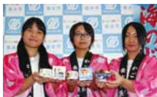
◎カンパチ缶詰のデザイン