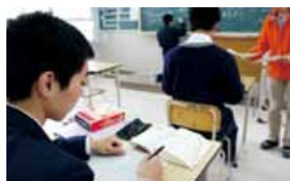
◎英検2級にもチャレンジ！