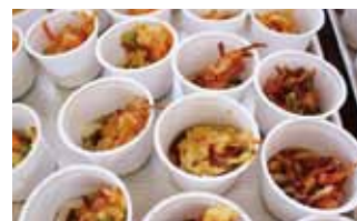
◎文化祭で手打麺の試食会