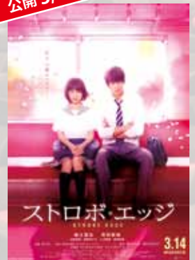
ストロボ・エッジ