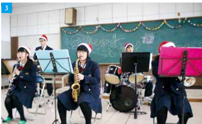
1 / 1年生5名 2年生1名で活動中 2 / 第1回たるみず吹奏楽フェスタに出演 3 / 校内でのクリスマスミニコンサート