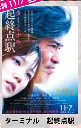
ターミナル 起終点駅