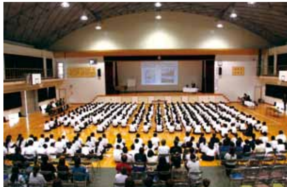
●講演会の様子 / 垂水中央中体育館 / 本校は1・2年生が参加