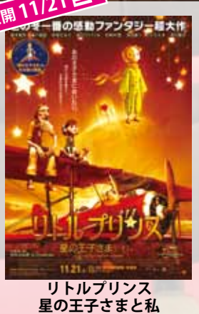
リトルプリンス 星の王子さまと私