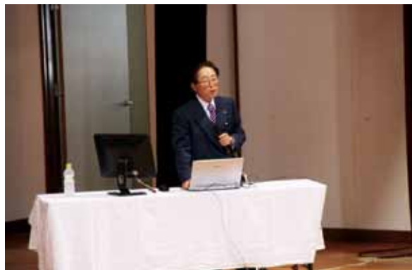
●郷土への思いや、生徒へのメッセージを熱く語っていただきました