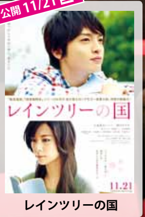
レインツリーの国