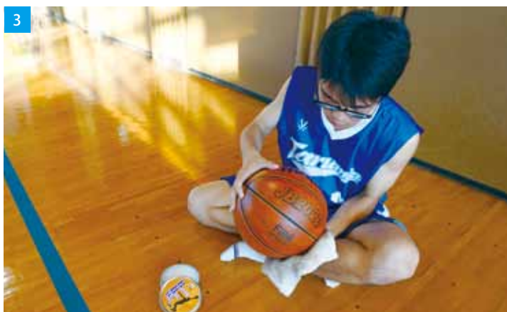
1／新調したユニフォームで勝利を目指す 2／人数は少ないですが充実した練習メニュー 3／ボール磨きは日課