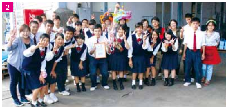
1 / 完成したよくばり丼 2 / 表彰式の後の記念撮影