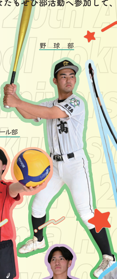
野 球 部