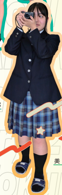
美 術 部