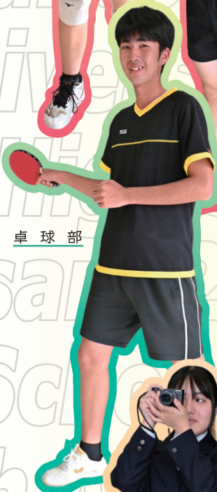
卓 球 部