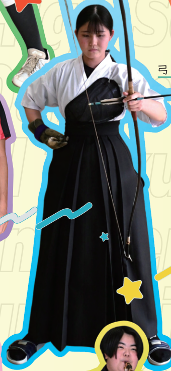
弓 道 部