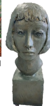
鶴桃佳『憂いている』