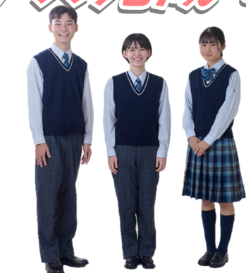
↓夏服Ver. 中間服Ver. ↑