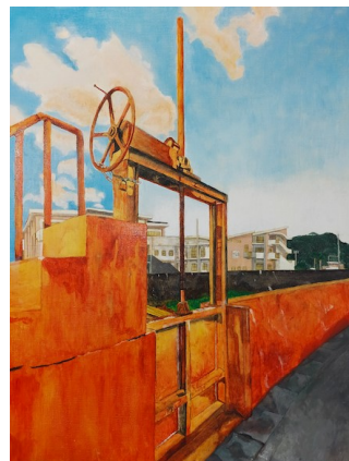
太山颯『帰還不能点』