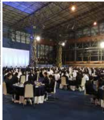
いぶすきいわさきホテルでの食事

「高校生になって知識や理解が深まった今、平和会館で語り部の話を聞くとき、心に響くものがあった」「家庭科で学習したテーブルマナーをホテルの料理で実践できた」「旅行会社の方から誕生日を祝ってもらって嬉しかった」「学校では見ることができない友達との意外な一面をこの時期だからこそ、クラスの友達と交流が深まりとても楽しかった」など、それぞれの感性で修学旅行を十分に楽しんだことが伝わってきました。