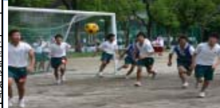
前期クラスマッチ ☆13R・22R・38Rが学年優勝 六月十八日(月)の午後と十九日(火)の終日にわたる前期クラスマッチが行われた。

一学年集団読書 六月四日(月)、LHRの時間に一年生の集団読書が行われた。今回の課題図書は幸田文の『おとうと』で、各クラスの委員長・副委員長・HR運営委員が中心となって、「家族愛」をテーマにクラスでの討論や意見交換の実施計画を立てた。