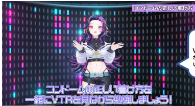
【動画】Youtube Vtuber ZONEY (ゾニー) が教えるコンドームの正しい 付け方