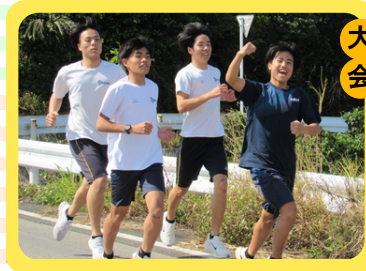
大会 ロードレース