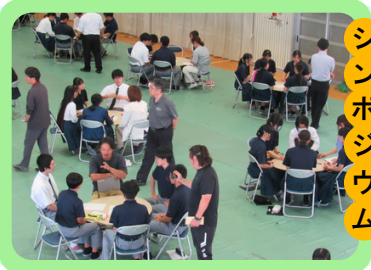
ゆんぬ探究 シンポジウム