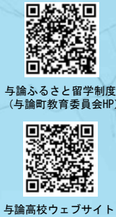
与論ふるさと留学制度

本校への入学を希望する中学生・保護者の皆様には、与論町のふるさと留学制度があります。また、与論高校の情報はウェブサイトにて随時発信しています。詳しくはこちらをご覧ください。