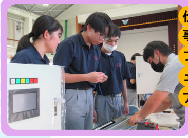
しまの 仕事フェア