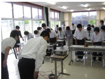
キャリアアップ講座

職場見学、キャリアアップ講座、実習激励会・反省会、就労支援セミナー、職場実習のための事業所面接会、障害者就職面接会、鹿児島県障害者技能競技大会、技能講習会