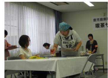
アビリンピック(喫茶サービス)