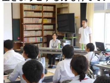
卒業生の体験発表