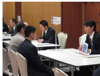
職場実習のための事業所面接会