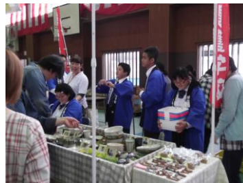
指商デパート参加（販売）