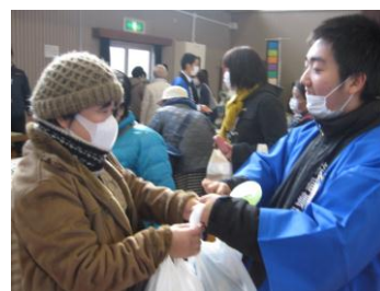
いぶようマーケット