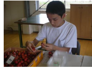
ミニトマトの選果