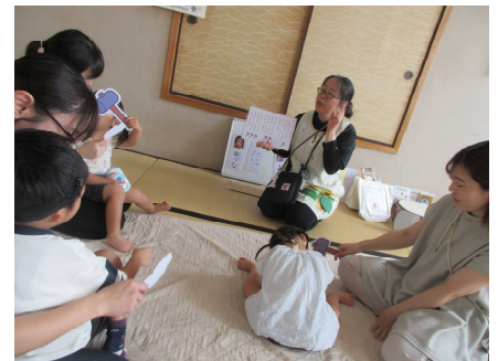
R7 鹿屋地区出張相談の様子