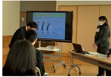
ハローワークによる面接練習