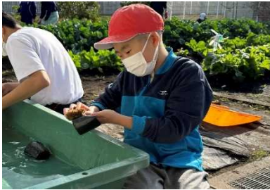
小学部【中学部体験】

卒業後の生活を安心して過ごすために、福祉サービス事業所、相談支援事業所、企業、関係機関との連携の充実を図ります。