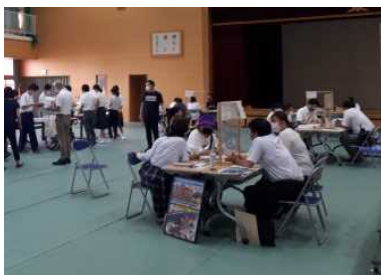
福祉事業所等説明会