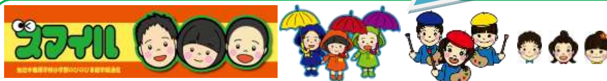
学級経営用イラスト（一部）