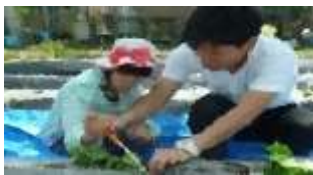
〈サツマイモの苗植え〉

今年は3人の1年生を迎え、現在、3年生が1人、のびのび学級が25人、いきいき学級が2人、計28人の子どもたちが在籍しています。みんな学校が大好きで、登校時は「おはよう！」の声かけに、とても素敵な表情で登校してきます。