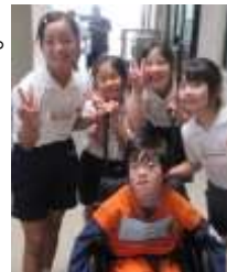
〈竜門小との交流学习〉

学年を越えた子ども同士の学び合いの場である合同生活単元学習では、5月はみんなでサツマイモの苗植えをしました。また5月に竜門小、6月には錦江小との交流があり、地域にも多くの友だちを作ることができました。