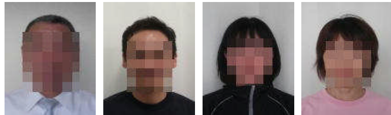
事務長 小学部 小学部 小学部