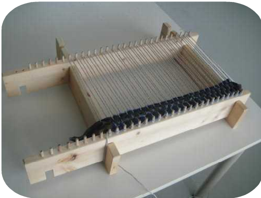
② ランチョンマット用